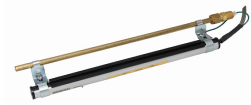
Brass Air Tube, (shown with 模型 6100EC) 模型 4275