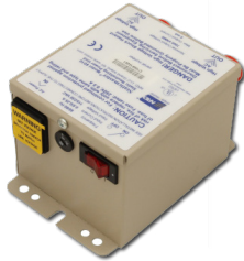
模型 6100ER, 6100ERC, 6100EC (sold separately)